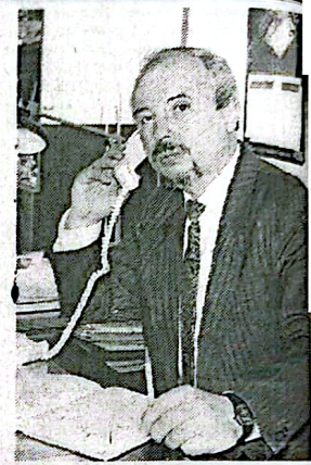
В частности, две фирмы из Индии предлагали создать совместное российско-индийское предприятие по изготовлению и поставке литур

В 90-е годы интерес к этой проблеме вырос и мне удалось выступить на международных конгрессах в Голландии и Китае. В это же время мы получили ряд практических предложений по разработке тех-ологий получения литур с высоким наследственным эффектом от зарубежных фирм.