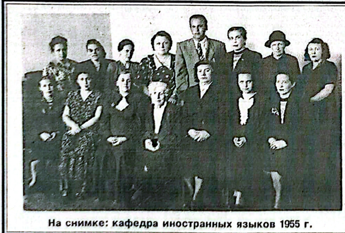
На снимке: кафедра иностранных языков 1955 г.

Предельную практику я проходил на моторостроительном заводе в городе Омске, куда меня тогда пригласили на работу. Здесь мне посчастливилось принимать участие в освоении новых авиационных изделий, и где я познал тонкости литейной технологии, и где меня научили любить литье. Моим первым учителем, который привил мне